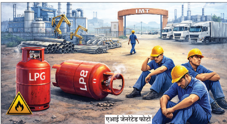
एआई जेनरेटेड फोटो

शहर के औद्योगिक नक्शे पर तेजी से उभरा चौधरी रणबीर सिंह इंडस्ट्रियल मॉडल टाउनशिप (आईएमटी) इन दिनों एलपीजी संकट की मार से जूझ रहा है। करीब 4000 एकड़ में फैला यह औद्योगिक क्षेत्र इन दिनों धीमी रफ्तार से चलने को मजबूर है। गैस की कमी ने यहां की फैक्ट्रियों की उत्पादन क्षमता को इस कदर प्रभावित किया है कि इसका असर उद्योग, लागत और रोजगार तीनों स्तरों पर साफ दिखाई दे रहा है। उद्योग संगठनों के अनुसार, एलपीजी की कमी के चलते कई इकाइयों में उत्पादन 20 से 40 प्रतिशत तक घट गया है। खासकर वे उद्योग, जिनकी उत्पादन प्रक्रिया सीधे गैस पर निर्भर है, सबसे अधिक प्रभावित हुए हैं। छोटे और