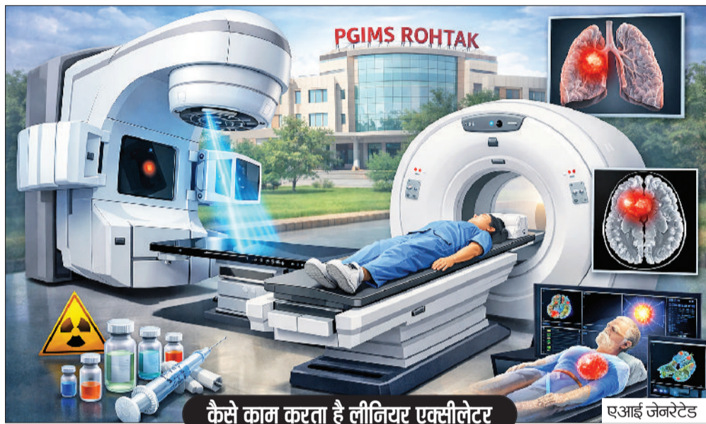
कैसे काम करता है लीनियर एक्सिलेटर

हरियाणा के प्रमुख चिकित्सा संस्थान पंडित भगत दयाल शर्मा पोस्ट ग्रेजुएट इंस्टीट्यूट ऑफ मेडिकल साइंसेज (पीजीआईएमएस) में अब कैंसर मरीजों के लिए अत्याधुनिक रेडियोथेरेपी सुविधा उपलब्ध हो गई है। कई वर्षों के लंबे प्रयासों और प्रशासनिक प्रक्रियाओं के बाद करीब 37 करोड़ रुपये की लागत से दो आधुनिक मशीनें स्थापित की गई हैं, जिससे हजारों मरीजों को बड़ी राहत मिलने की उम्मीद है। संस्थान को सीएसआर के तहत लीनियर एक्सिलेटर और सीटी सिम्युलेटर मशीनें मिली हैं। इन मशीनों के शुरू होने से पीजीआईएमएस में कैंसर का इलाज अधिक सटीक, सुरक्षित और प्रभावी तरीके से किया जा सकेगा। खास बात यह है कि जहाँ निजी अस्पतालों में रेडियोथेरेपी का खर्च 2 से 2.5 लाख रुपये तक पहुँच जाता है, वहीं पीजीआईएमएस में यह सुविधा मरीजों को मुफ्त उपलब्ध कराई जाएगी। इससे आर्थिक रूप से कमजोर वर्ग के मरीजों को सबसे ज्यादा लाभ मिलेगा। यह सुविधा विशेष रूप से मुँह के कैंसर, फेफड़ों के कैंसर और अन्य जटिल प्रकार के कैंसर के इलाज में उपयोगी साबित होगी। आधुनिक रेडियोथेरेपी तकनीक के माध्यम से कैंसर कोशिकाओं को सटीक रूप से निशाना बनाया जाता है, जिससे आसपास के स्वस्थ ऊतकों को कम नुकसान होता है और मरीज की रिकवरी बेहतर होती है। इससे पहले पीजीआईएमएस में रेडियोथेरेपी से कैंसर के उपचार की सुविधा उपलब्ध नहीं थी।