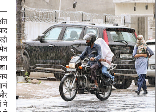
रोहताक। बारिश में अपने गंतव्य को जाते मोटरसाइकिल सवार।

मौसम की अनिश्चित चाल ने इस बार रबी सीजन के अंत में किसानों की मुश्किलें बढ़ा दी हैं। मंगलवार दोपहर बाद से रोहताक व आसपास के क्षेत्रों में रुक-रुक कर हो रही बूढ़ाबांदी ने किसानों की सांसें अटका दी हैं। गेहूं समेत सरसों और अन्य रबी फसलों की कटाई का समय चल रहा है, लेकिन आसमान साफ होने का नाम नहीं ले रहा। कुछ दिन पहले चौधरी चरण सिंह कृषि विश्वविद्यालय हिसार द्वारा जारी पूर्वानुमान में कहा गया था कि 31 मार्च तक पश्चिमी विक्षोभ की गतिविधियां थम जाएंगी और मौसम साफ हो जाएगा। इसी उम्मीद में कई किसानों ने कटाई की तैयारियां शुरू कर दी थीं। लेकिन मौसम ने अचानक करवट ले ली और बूढ़ाबांदी ने खेतों में खड़ी फसल को जोखिम में डाल दिया।